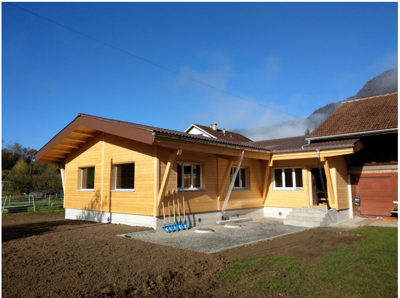
Foto des Klubhauses MEFEZ

Im Eisenbahn-Amateur Nr. 4/2020 findet ihr einen Beitrag ab Seite 176.